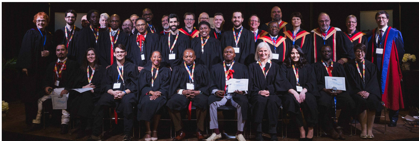
La cohorte des finissants 2018-2019 avec quelques dignitaires et enseignants.

Enfin, tous ceux présents se sont unis dans un temps de prière pour les finissants, les Églises et la mission.