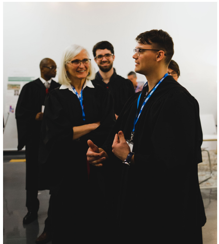
Moments croqués sur le vif.