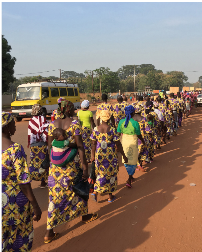
Légende photo : La marche à travers la ville d'Orodara

Cet article est publié dans le cadre du Réseau mennonite francophone et paraît aussi dans Le Lien (Québec) et sur le site de la Conférence mennonite mondiale ( www.mwc-cmm.org ). Coordination de la publication des articles : Jean-Paul Pelsy.