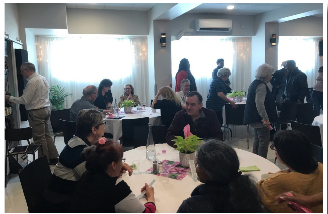
Photo du repas du 28 avril 2019.

L'autre événement qui s'est tenu en avril était en lien avec la semaine de l'action bénévole qui a été soulignée partout au Québec au début du mois. C'est donc le 28 avril que s'est tenue, en matinée, une célébration Hommage à nos bénévoles (serviteurs et servantes du Seigneur). Musique, témoignages, remerciements, et réflexion biblique étaient au rendez-vous.